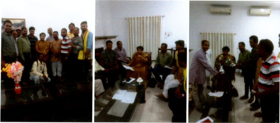
(एस.सी.,एस.टी. डिफेन्स इम्पलाईज कौंसिल जी.सी.एफ.जबलपुर गोंड समाज महासभा जिला जबलपुर के प्रतिनिधियों के साथ सुश्री अनुसुईया उइके जी उपाध्यक्ष)

Anusuiya सुश्री अनुसुईया उइके/Miss Anusuiya Uikey उपाध्यक्ष/Vice Chairperson राष्ट्रीय अनुसूचित जनजाति आयोग National Commission for Scheduled Tribes भारत सरकार/Govt. of India नई दिल्ली/New Delhi