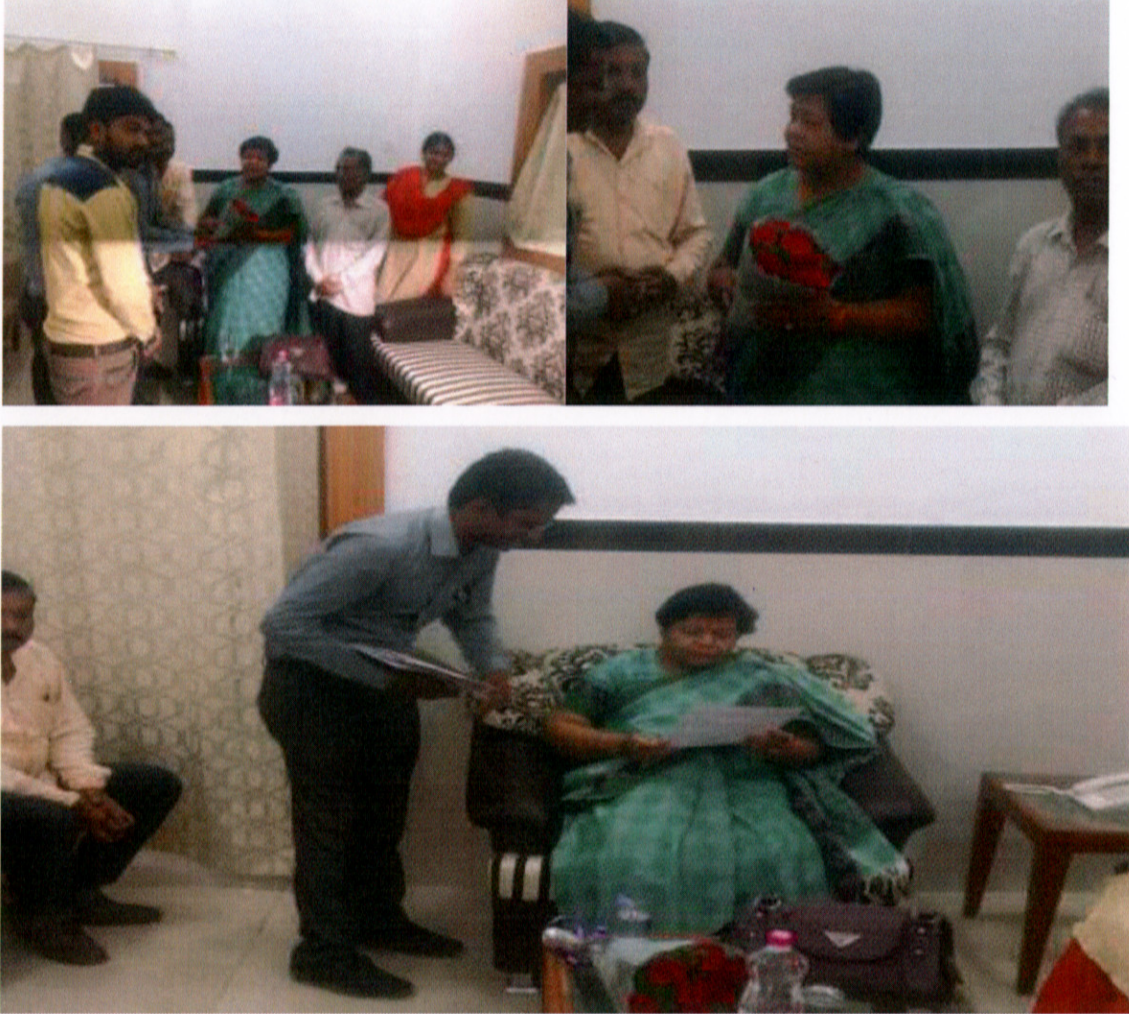
(नागपुर आदिवासी संगठनों से मुलाकात करते हुए)