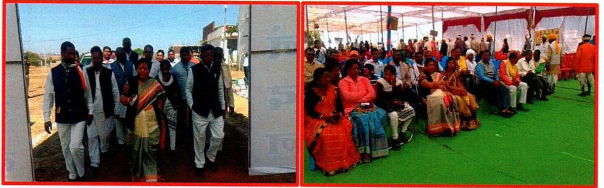
(गोंड समाज महासभा मध्यप्रदेश के प्रांतीय अधिवेशन में सुश्री अनुसुईया उइके, उपाध्यक्ष, रा.अ.ज.जा.आ. का अभिनंदन एवं जनजाति सदस्यों के मध्य उपस्थिति)