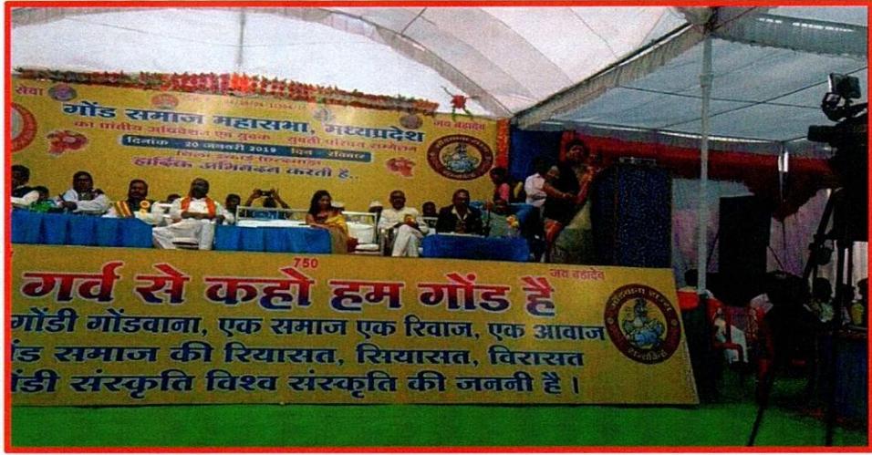
(गोंड समाज महासभा मध्यप्रदेश के प्रांतीय अधिवेशन में सुश्री अनुसुईया उइके, उपाध्यक्ष, रा.अ.ज.जा.आ. मंच पर अपना संबोधन देते हुए)

14. विभिन्न जनजाति संगठनों के पदाधिकारियों ने मुझसे व्यक्तिगत रूप से भेंट कर अपनी समस्याओं के ज्ञापन भी प्रस्तुत किये। उनके द्वारा बताया गया कि :-